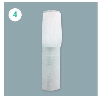
geschlossen zur Fixierung